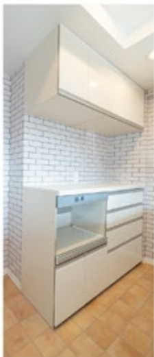
② 開口部を広げたキッチンは白でまとめ、明るく開放的な空間に。