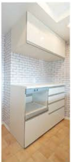
② 開口部を広げたキッチンは白でまとめ、明るく開放的な空間に。